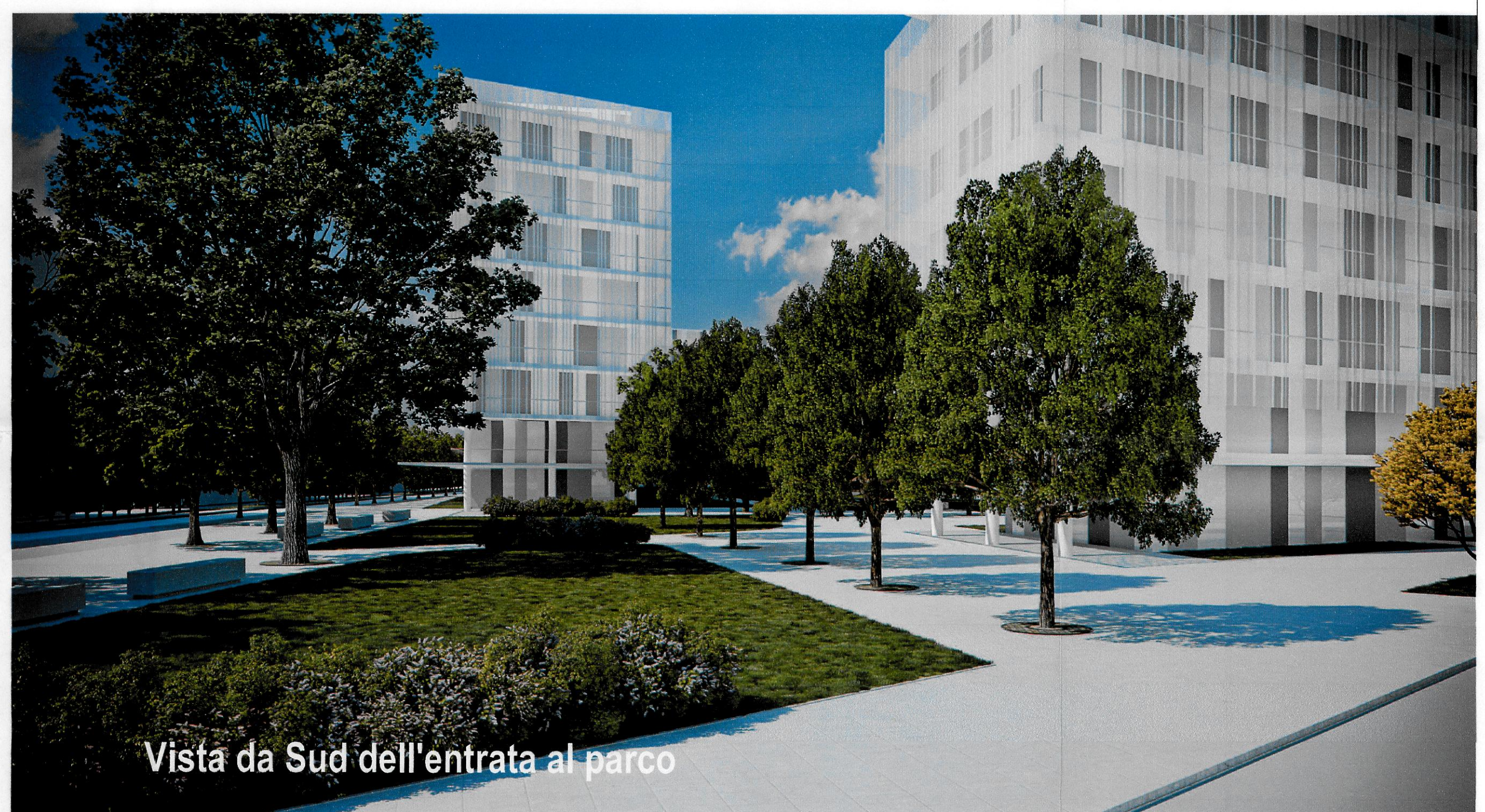
Vista da Sud dell'entrata al parco