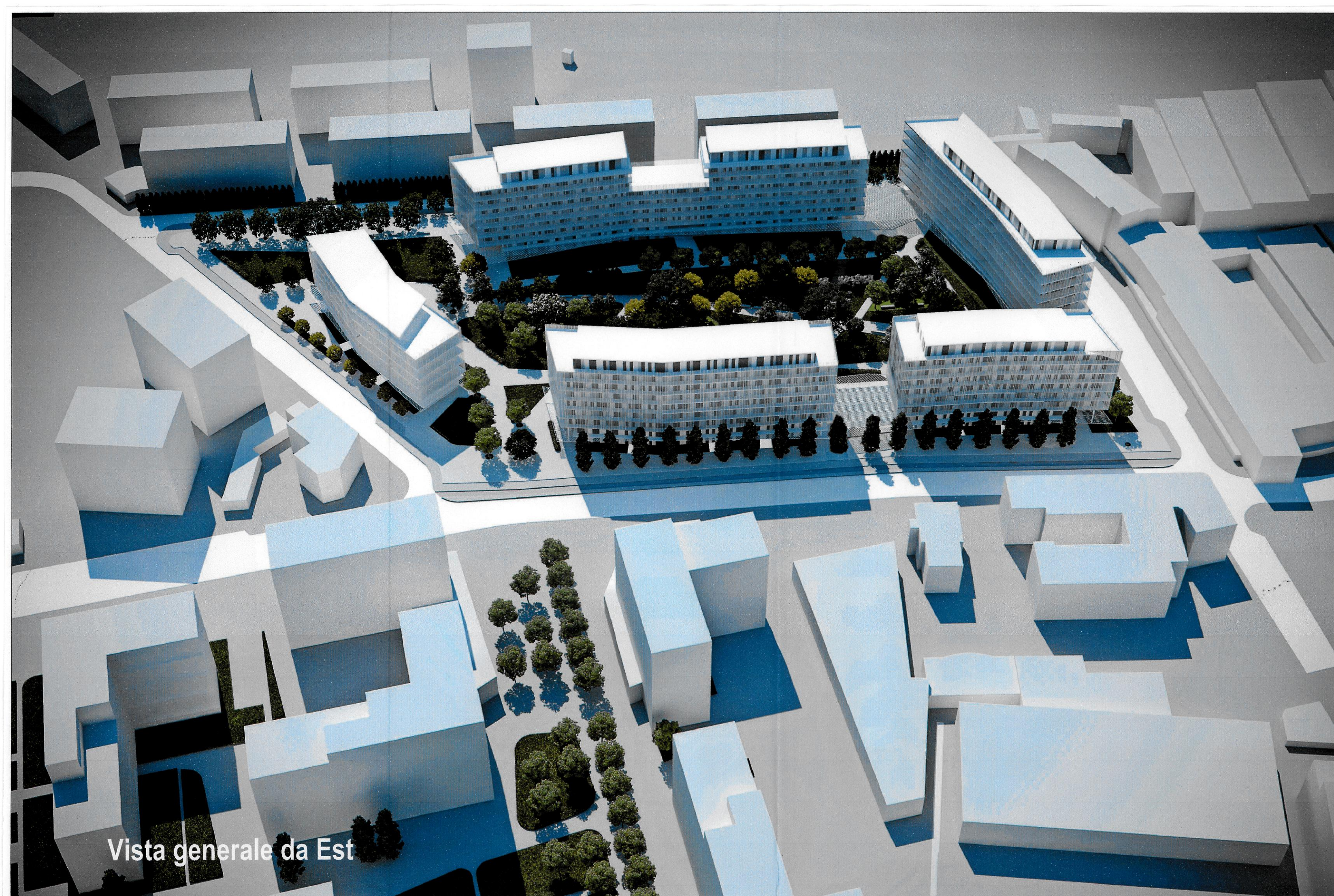
Vista generale da Est