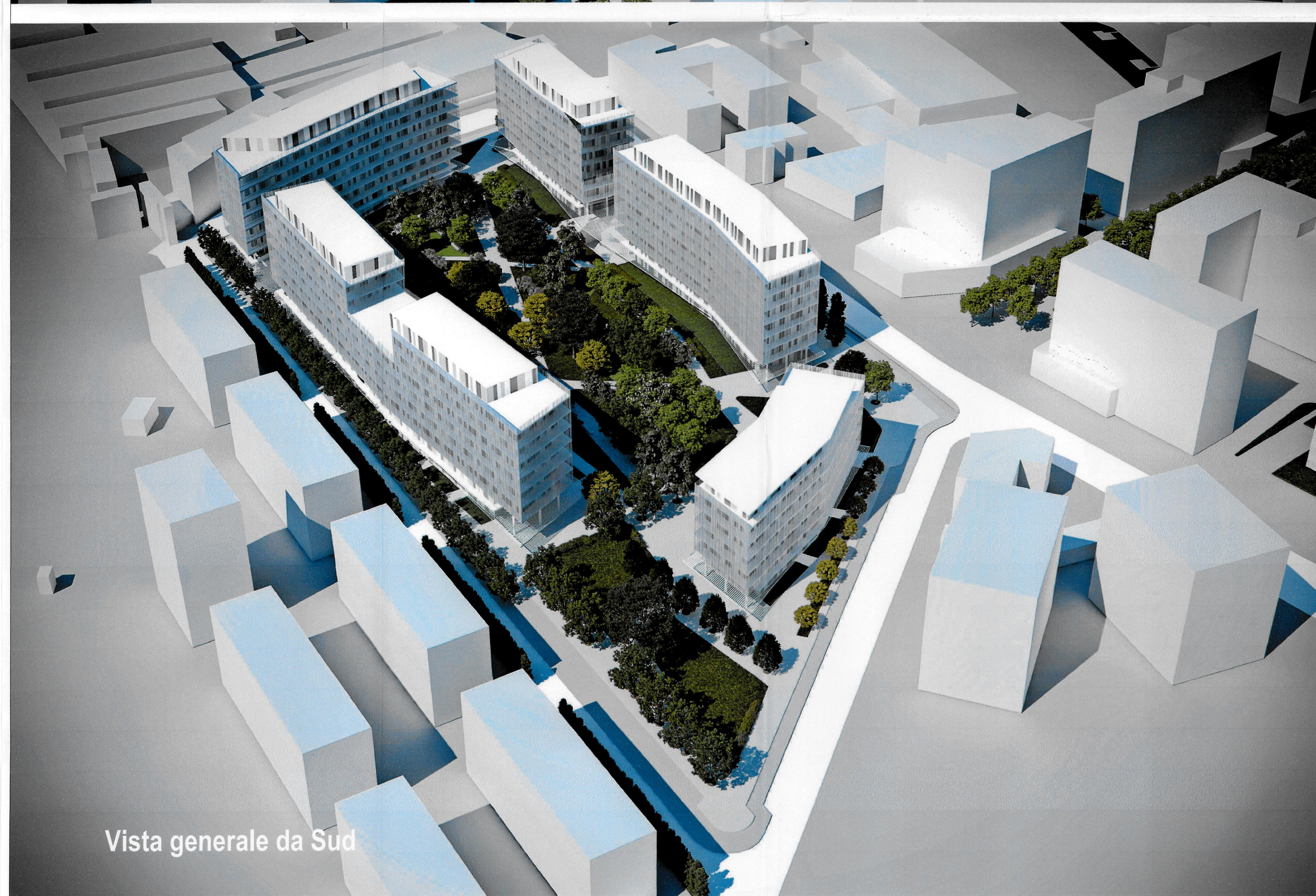
Vista generale da Sud