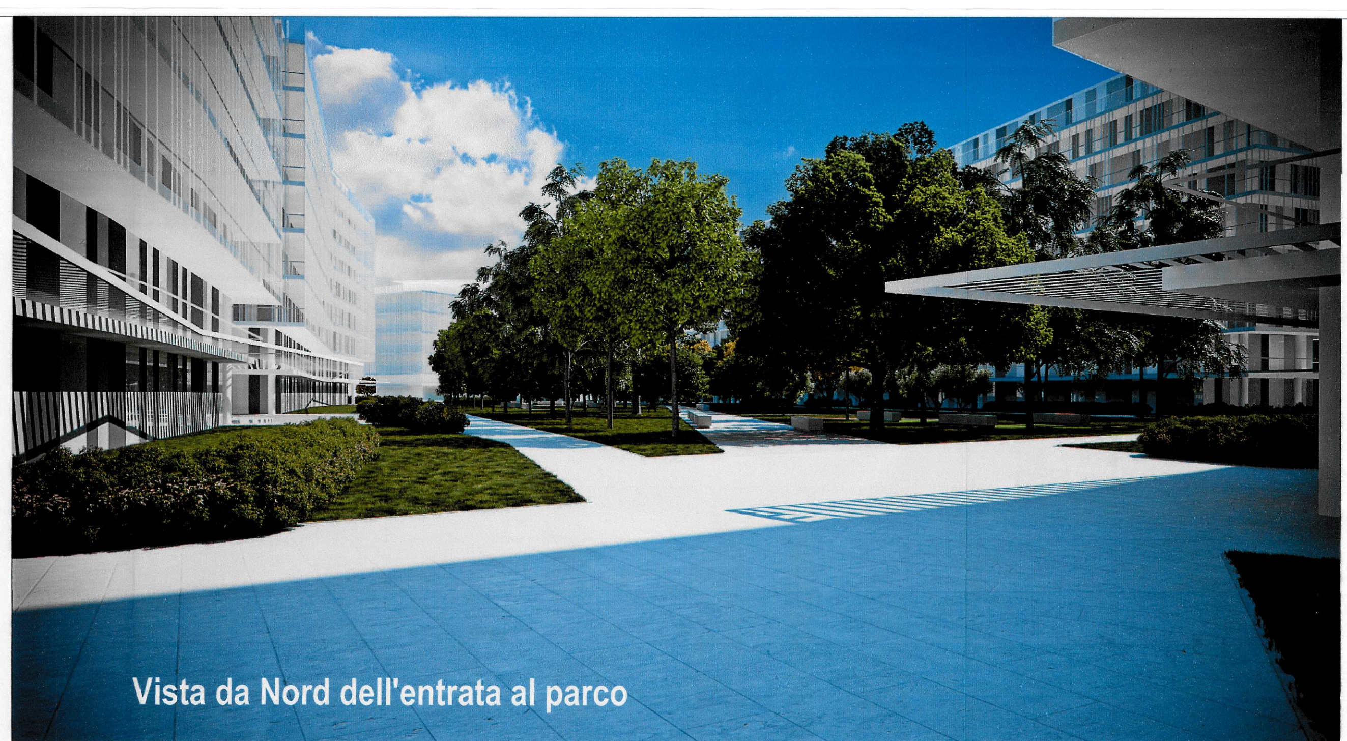
Vista da Nord dell'entrata al parco