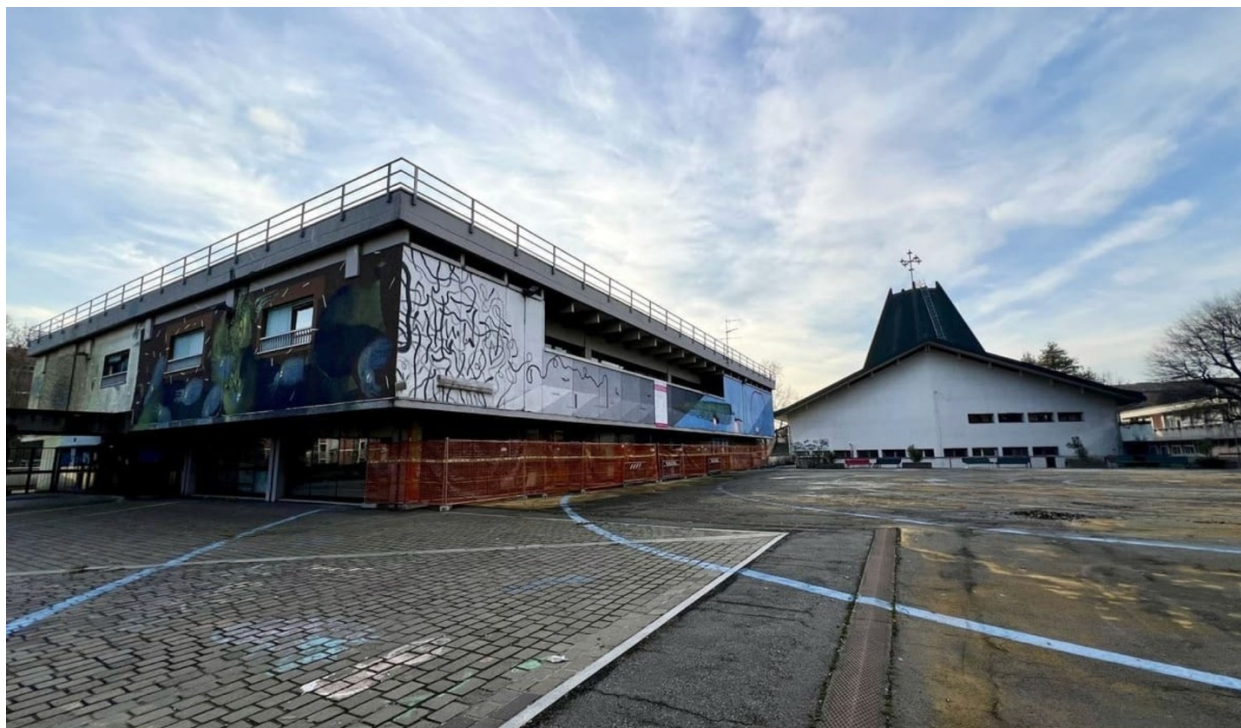
Teatro Ringhiera e Casa di Quartiere - Progetti degli interventi finalizzati alla riqualificazione