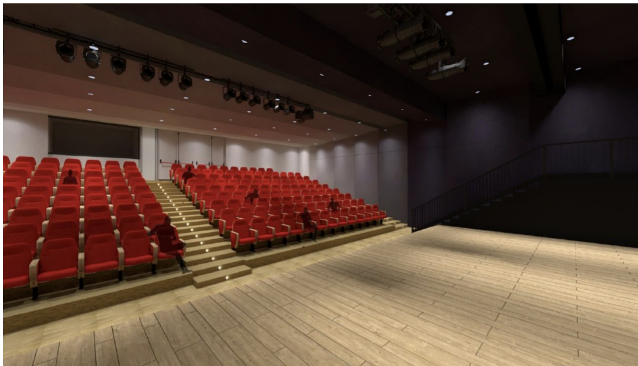
Rendering sala teatrale