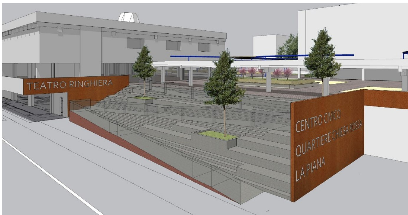
Rendering scala piazza Fabio Chiesa

L'inizio dei lavori è previsto per settembre 2026 e la fine è prevista per dicembre 2027.