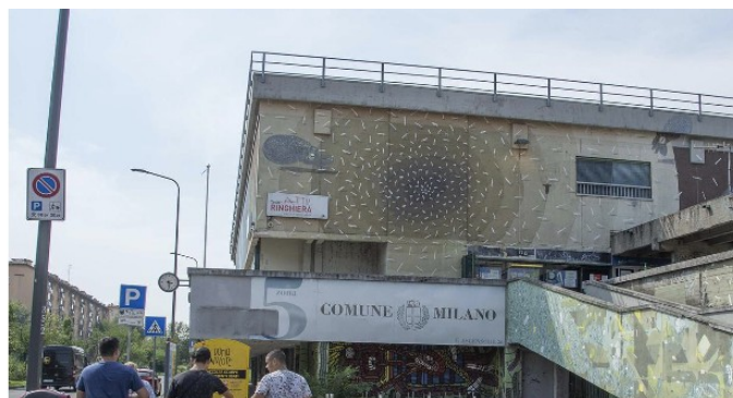
Centro per l'impiego di via Boifava